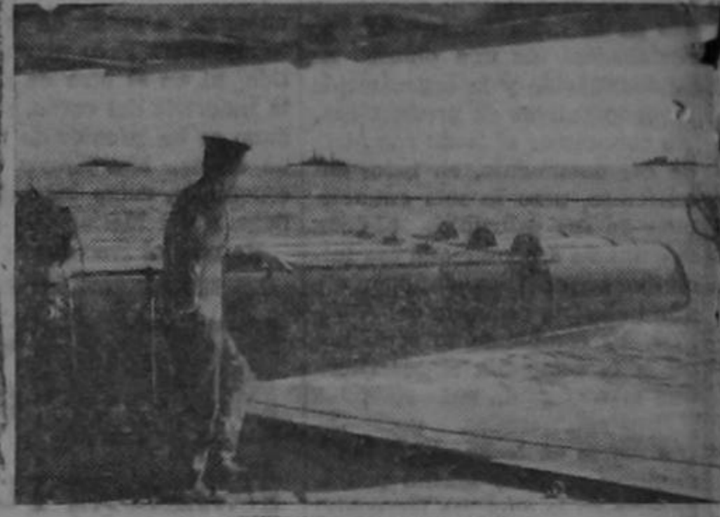
En los avances de las tropas británicas en Irán, los cuerpos montados cumplieron papel importante en cubrir los flancos del ejército y en los trabajos de patrulla y reconocimiento.

EDGAR YOUNG Comerciante Establecido en la Provincia por más de 20 años Vende al detal, Vinos y Licores extranjeros y del país. ABARROTES en general. MISCELANEA Establecimiento esquina Norte del Mercado.